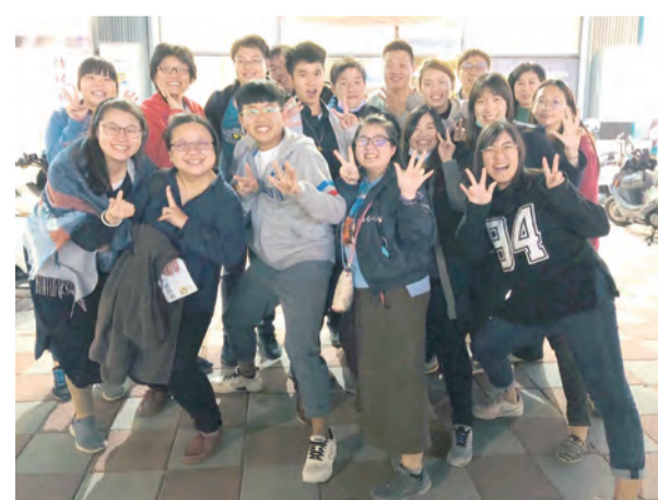
▲即使寒假陶成營因疫情而暫緩，工人們的共融營卻持續舉辦。做出深刻的省思與分享。

信仰陶成營一直是大專同學會成員們寒暑假的重心，所有夥伴心繫著準備工作，線上討論、彼此關心進度，為營期預備，也很期待夥伴及學員美麗的邂逅，以及與天主相遇；但隨著疫情增溫，許多同時段的各大營隊或活動都因避免群聚感染而取消，陶成營是否還要繼續？當下的我心中突然有很多聲音。如果繼續，在防疫前提下，活動一定會有些限制，夥伴和學員的感受會如何呢？如果取消，工人半年來的努力是否化為