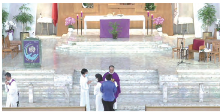
▲在恭領聖體的禮儀中，信友無法出列跟著領聖體，此時虔心神領聖體，邀請主耶穌到心中，非常重要。

事實上，從現實生活中我們看到，「偏見」會讓我們彼此之間的關係受到阻礙，甚至給對方帶來無盡悲慘的傷害。然而，在這段福音裡，耶穌卻藉著醫治那位衝破心理那道圍牆的癩瘋病人，而與這位癩瘋病患一起創造了一個超越偏見、跨越「潔淨」與「不潔淨」界限的美麗故事。但願這個美麗故事能夠啟發我們，努力去跨越那些阻礙發展人性美善的界限，這些界限可能是「潔淨」與「不潔淨」之間的鴻溝，也可能是敵和我之間的誓不兩立，當然，這界限更是活生生的我們社會裡那些非得爭個你死我活的集體意識形態。而要跨越這些界限，我們需要擁有一個比這些界限更高的角度、更寬廣的視野，以及比個人和群體利益更超越的天主，