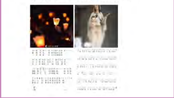
▲跟著神父精心帶領的聖歌及祈禱，每天在手機Line上為疫情早日平息而祈禱。

為世界冠肺炎疫情有效控管祈禱——守聖時第40日。特別為在日本的疫情控制獻上祈禱，求好耶穌看顧困境中的人們。《野地的花》、《請求瑪利亞》聖瑪利亞仁慈之母，為我等祈！大聖若瑟聖家之長，為我等祈！護守世人的諸天使，為我等祈！