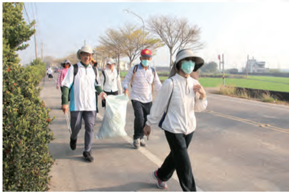
▲朝聖隊沿途撿拾垃圾淨街，以實際行動愛護環境。

上午10時30分左右，朝聖隊伍抵達另一座百年教堂——西螺天主堂，堂區司鐸與教友熱烈迎接徒步朝聖隊，在西螺堂祈禱、朝拜聖體及稍事休息後，隨即啟程往下一站：二崙鄉港後聖家天主堂。這座小聖堂雖不具百年歷史，但有著特別的意義，它是台灣本土第二位神父李天一神父的故居，也是李神父親自建造的，目前是屬於西螺天主堂的分堂。進入聖堂做簡短的祈禱與歇腳後，徒步朝聖隊繼續向崙背挺進，在下午4時30分左右順利抵達第一天行程的終點站——崙背堂。崙背天主堂開教於1905年，迄今已115年，蒙天主恩佑，這座鄉村小堂一直保有當年開教時期之熱心，在此，產出1位