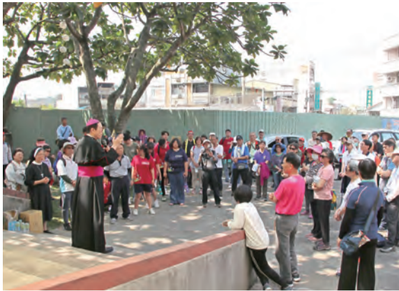
▲鍾安住主教期勉追尋嘉義教區傳教士福傳足跡。