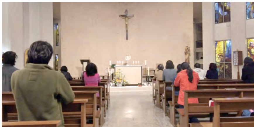
▲南松山天主堂大方回應主耶穌的邀請，堂區因經常舉行明供聖體而得力復興，歡迎更多人一起陪伴主耶穌，努力讓這份愛火持續常燃不熄。