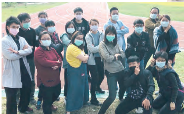
▲營隊輔導及工人們戴著口罩一同拍攝影片，對今年7月將舉行的92陶成的學員們精神喊話，鼓勵打氣。

每天看著新聞，感受著疫情的情勢發展，我們輔導、秘書和營長、副營長就很快地接連召開線上會議，先是輔導團的線上交談，再邀秘書及同學加入：我們開會，先輕鬆地分享過年的生活，接著，就一一的分享心情感受。在放假還