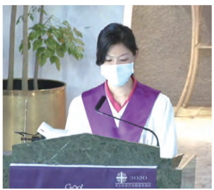
▲在視訊彌撒中該有的禮儀都不能省略，信友可跟著答唱詠作應答。

首先，承認我們生命裡存在著許多荒謬，但有什麼荒謬會比得上天主為了愛我們，而讓祂的獨生子取了人的肉身，降生成人，最後甚至被祂所愛的人釘死在十字架上更為荒謬？聖保祿宗徒就深深體會到十字架的「荒謬」道理，為那些自以為聰明的人是愚昧的，但對相信的人卻是天主的大能。是的，因著愛，天主願意被看成荒謬，以至於讓我們在生命的荒謬