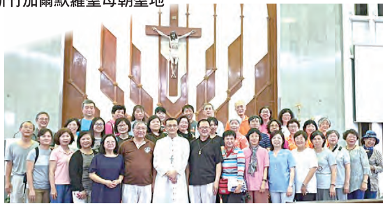
▲最後一站參加亞庇無玷聖母主教座堂主日彌撒，與黃士交主教合影。

愛唱歌的我錯過去年西馬的聖詠交流，必定要把握今年的東馬之行，集訓後發現自己曲目生疏，聲調難融，緊張地勤於彈唱聽歌，反複