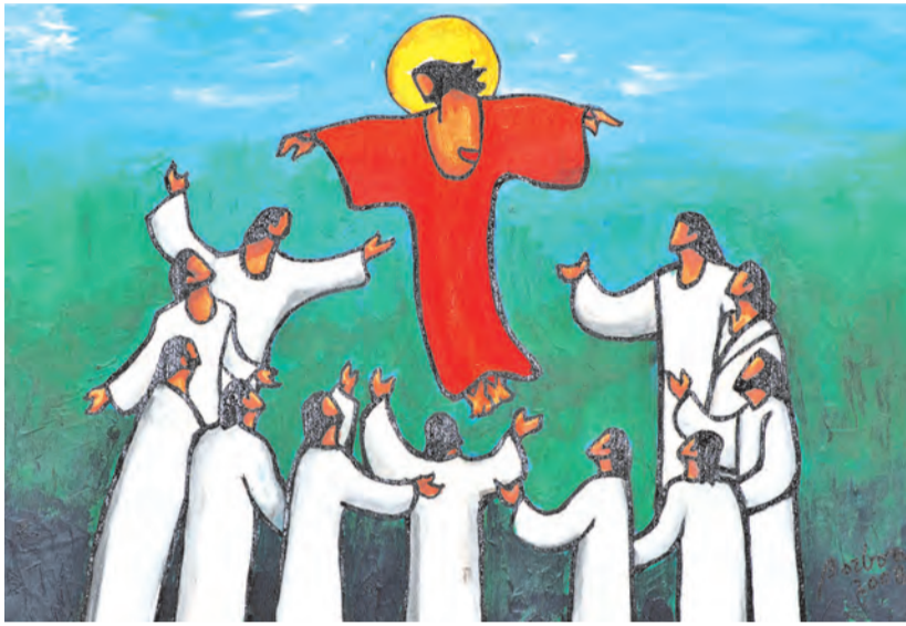
▲主耶穌在升天之前吩咐門徒們說：「你們要去使萬民成為門徒，因父及子及聖神之名給他們授洗。」

對觀福音提到，耶穌受若翰的洗禮(參閱谷1:9-11; 瑪3:13-17; 路3:21-22)。《若望福音》僅是暗示這件事，但並未提及耶穌受洗的場景(參閱若1:29-34)。耶穌受洗是啟示的時刻。福音以強而有力的象徵描述天主臨在此事件中。正如《依撒意亞先知書》64:1處，先知要求天主「衝破諸天降下」，耶穌受洗時，天也開了，這意味著耶穌身上有天主大能和臨在的新啟示。福音作者提到天主聖神以有形可見的方式在耶穌身上顯現，描述「聖神有如鴿子降在祂上面。」(參閱谷1:10; 瑪3:16; 路3: