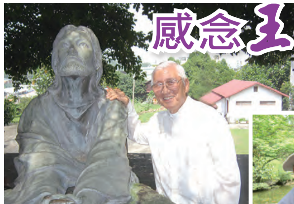
▲一生緊緊跟隨耶穌