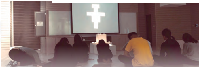
▲在泰澤祈禱中，我們交付全球疫情帶來的不安和痛苦，求主垂顧。