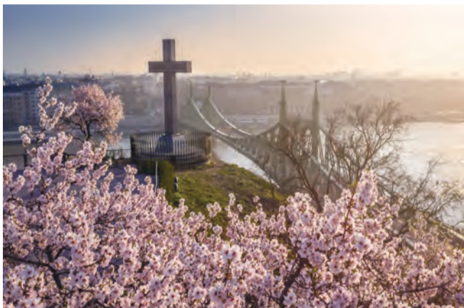
▲第52屆國際聖體大會邀請您一起在美國的布達佩斯相遇

感恩祭是默西亞筵席的行動，邀請我們在同一餐桌上的共融及宇宙性的共聚，不僅只為了信徒，同時也為了整個人類。事實上，感恩祭並不僅僅是個人信仰的象徵；慶祝感恩祭並非是要強化特殊或樹立障礙，而是要摧毀隔離，敞開普遍得救的召喚。不幸的是，在目前的情況下，所有已領過洗的信友，無論隸屬哪個基