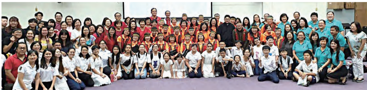
▲最後一站亞庇無玷聖母主教座堂，這是充滿喜樂、動感、淚水的最後一場交流會。