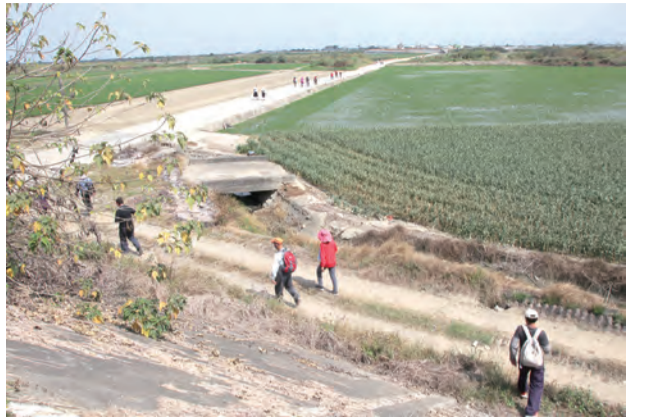
▲將3天徒步苦行全部奉獻給天主，重新檢視自己的信仰。