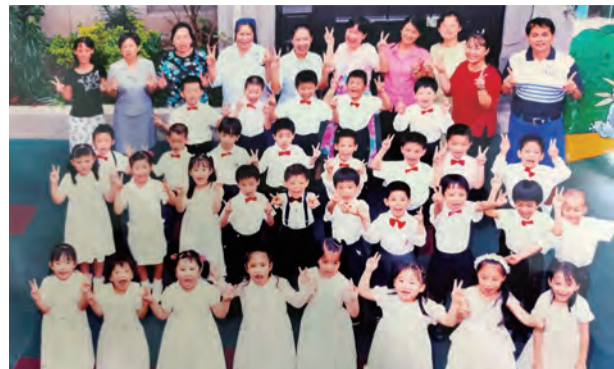
▲在仁愛會修女陪伴下，幼兒園的孩子們都在愛中成長。

同年，服務於士林堂的修女們照慣例，大街小巷穿梭拜訪教友、探望病人，漸漸地注意到舊土林的傳統市場，以及緊鄰教堂後面的市