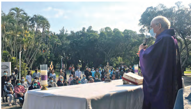
▲輔大淨心堂彌撒改在校園內露天舉行，走出密閉空間，減少感染機會。 ◀聖伯多祿廣場以超大螢幕直播教宗三鐘經活動，信友們駐足參禮。