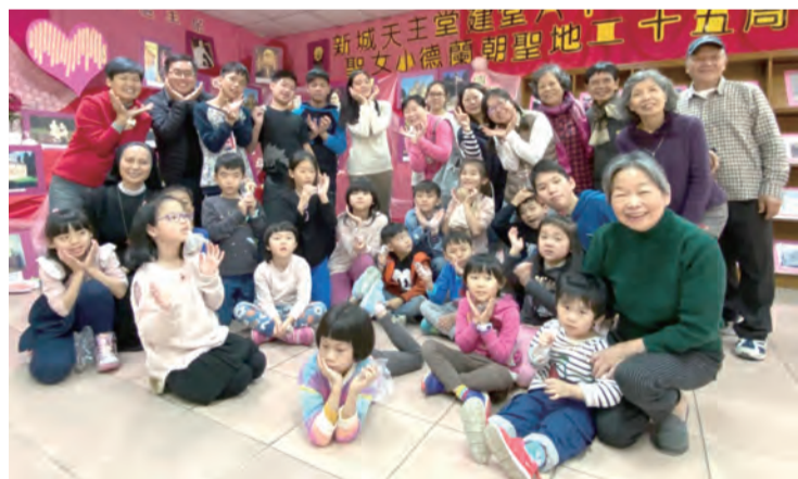
▲內湖天主堂主日學兒童朝聖之旅，大人小孩都歡喜豐收。

續下一個心靈的知性加感性時刻，手工DIY是大人小孩都歡喜期待的，聽完工作坊老師講解後，孩子們都興致勃勃地雀躍欲試，挑選從外觀是無法辨別真正完成後的形狀，哇！大家都認真地精挑細選啊！再加什麼顏色的蠟塊，關係到成品，或細心排列，或大膽一搏，展現手作創意。同行家長們也都喜樂地參與，盡情同樂，彷彿塵封的童年被喚醒。最後的成品，讓人既驚且喜，不論是形狀或是顏色，每個都有各自的特色，獨一無二。豐美的朝聖之旅，讓孩子們帶著滿意的心歡喜歸賦。