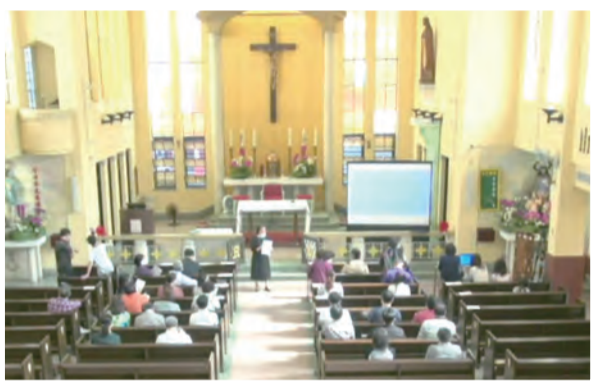
▲直播彌撒也應在小型的天主子民團體中舉行。

至於主日彌撒已經暫停的教區或堂區，信友們又要如何與主日彌撒有一個聯繫呢？在聖教宗若望保祿二世在〈主的日子〉書函中教導我們：「信友如果生病、行動不便，或是由於其他重大原因不能參與感恩祭，應該盡可能讓自己從遠處與主日彌撒結合，最好是按當日的彌撒經書來讀經、祈禱；也可藉著參與感恩祭的意願來與主日彌撒結合。……當然，這廣播本身並不能使人滿全守主日的本分，因為這本分要求我們參與在一個地方舉行的兄弟般的聚會，同時能領受聖體。但是對那些無法參加感恩祭，因此也寬免了這種本分的信友，廣播和電視則是一種很寶貴的幫助……這樣，主日彌撒也能為這些